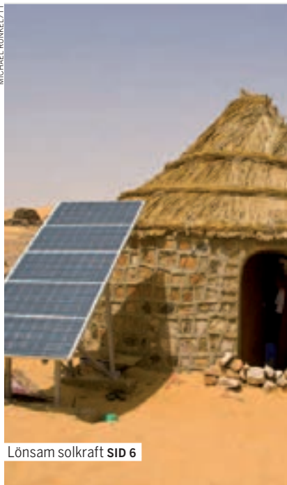
Lönsam solkraft SID 6