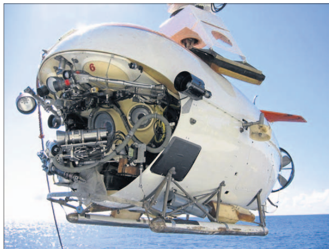
MIR I, som skal bringe Per Wimmer ned til Titanic, kan nå dybder på over 20.000 fod. Kabinen på bare 2,1 m i diameter kan rumme tre personer. Det tager tre timer at komme ned til Titanic.

Det sunkne Titanic blev genfundet den 1. september 1985 af en fransk - amerikansk ekspedition.